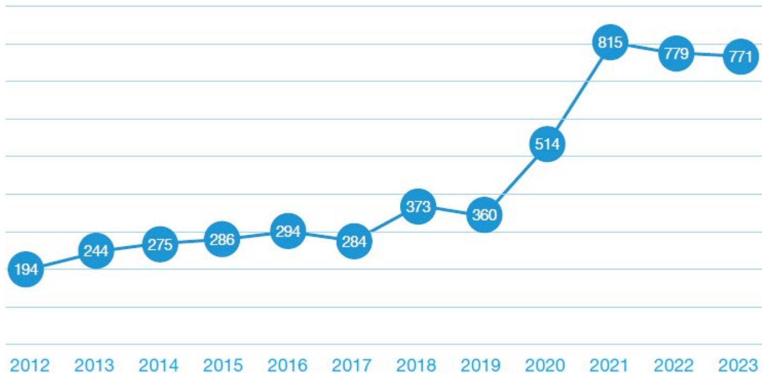
Numero di articoli scientifici EOC peer-reviewed dal 2012, fonte PubMed